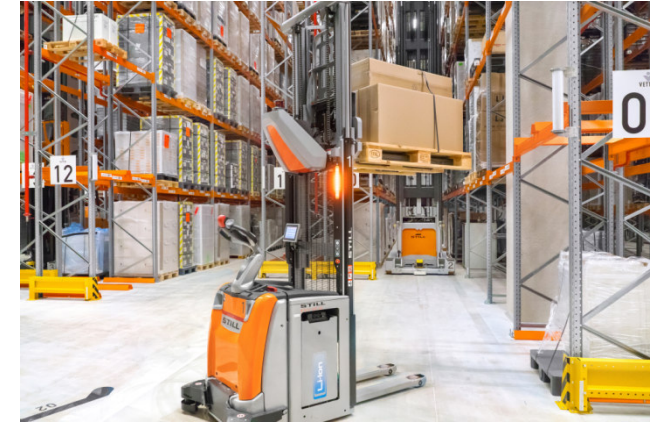
Automatik-Stapler, wie er bei Koch International im Lager Bramsche - Engter eingesetzt wird